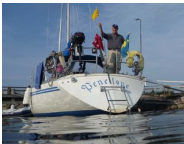
Ohoj och tack för en härlig eskader!