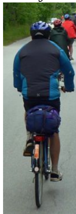
På cykel norrut

När vi sedan skulle fortsätta vår segling norrut visade det sig att det åter blev åska, hård vind och mycket regn. Så det blev en tredje dag i Visby då vi mellan skyfallen bl.a. tog oss till Almedalsbiblioteket där vi kunde sitta och torka i värmen, läsa tidningar och studera den fina Gotlandicasamlingen. Nu började den återstående tiden för vår eskader att bli knapp så nästa dag gav vi oss av tidigt i dimma. Eftersom vi inte riktigt gillade detta väder lyckades vi övertala vår eskaderledare att stanna över natten i Lickershamn, ett naturskönt fiskeläge halvvägs till Fårö. Här vandrade vi upp till Jungfrun, Gotlands största rauk. Via Halls Haug och Fårösund nådde vi nästa dag Lautershorn på Fårö. Nu hade vi max. tre dagar på oss att invänta bra väder för överfarten till Nynäshamn. Efter idogt lyssnande på väderleksrapporterna och moget övervägande beslöt vi att vänta en dag till.