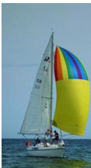
Spinnakern i topp!